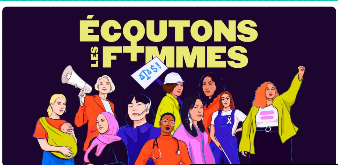
COLLECTIF 8 MARS | Journée internationale de